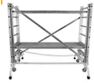
25,00 ZARGES Arbeitsbühne rollbar, klappbar f. Transport Podest 90 - 200 cm