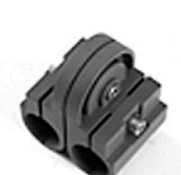
2,00 MULTITUBE 360° Gelenk