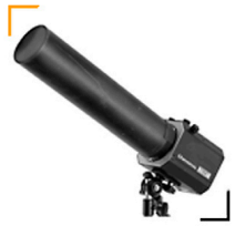
3,00 BALCAR BALCAR Spot-Tubus 8 cm