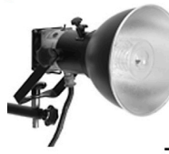
5,00 BLÄSING Reflektor f. Lampenkopf 30 cm