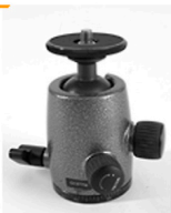
10,00 GITZO Kugelkopf