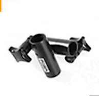
2,00 FOBA 90° Kreuzverbindung