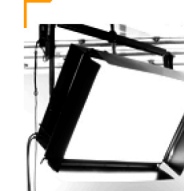
50,00 BLÄSING Lichtwanne 2-Rohr Motorteleskop für HELM 400 Profil 90 x 120 cm / 10.000 w/sec