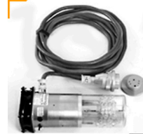
15,00 BLÄSING Lampenkopf max. 5000 w / Kabel 5 m