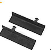
2,00 MANFROTTO Plattenträger