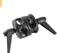
3,00 MANFROTTO Boom Clamp Multi Tube