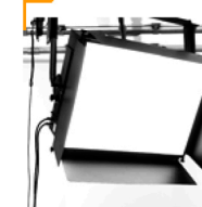
100,00 BLÄSING Lichtwanne 2-Rohr Motorteleskop für HELM 400 Profil 120 x 180 cm / 10.000 w/sec