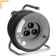
3,00 Kabeltrommel 230 V / 16 A 3 x 1,5 2 , Schukostecker