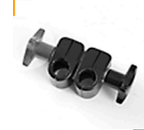
2,00 FOBA 360° Gelenkverbindung