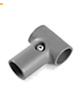
2,00 MULTITUBE T-Verbinder rund