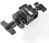
2,00 AVENGER Grip Head D200B 2 1/2"