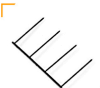
2,00 MANFROTTO Styro Gabel