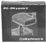
10,00 ELINCHROM Skyport Synchron-Set Sender / Empfänger div. Kupplungen