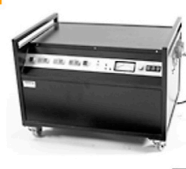
40,00 BLÄSING Generator HS - 5000 w/sec 4 Blenden / 3 Lampen