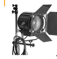
20,00 BLÄSING Fresnel-Spot 25 cm, Lampe fokussierbar, Filterrad, 4-Klappen