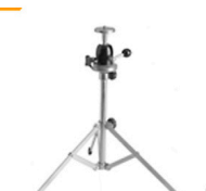
0,75 HAMA Tischstativ m. Kugelkopf Höhe 25 - 35 cm