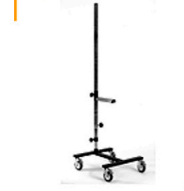
15,00 BLÄSING H-Fuß Einsäulenstativ Ausleger 30 - 450 cm