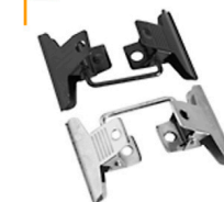
1,00 KLAMMERN Doppelklammern