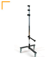
15,00 BLÄSING T-Fuß Einsäulenstativ Ausleger 40 - 130 cm Rohr 140 - 390 cm