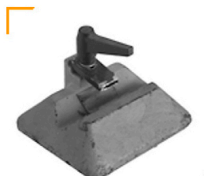
2,00 MANFROTTO Gewicht 7,5 KG