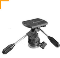
10,00 GITZO Drei-Wege-Neiger