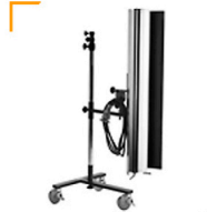
30,00 BLÄSING Lichtriegel 10 x 130 cm 2 Klappen, Plexi halbrund