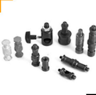
je 0,75 MANFROTTO Diverse Bolzen und Adapter