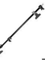
5,00 MANFROTTO Teleskopstange für Reflektoren bis 180 cm