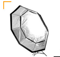
35,00 CHIMERA Octagon silber 170 / 190 cm 3 Scrim-Ebenen einsetzbar