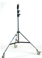
10,00 MANFROTTO Stahl-Klappstativ 130 - 340 cm, Feststellrollen