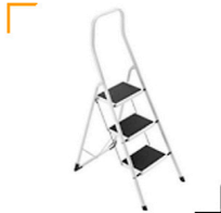
5,00 HAILO Safety 3 breite Stufen, Safty-Bügel Hohe 70 / 130 cm