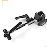
3,00 FOBA Gelenk m. Klemme