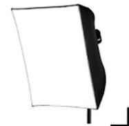
10,00 CHIMERA Softbox weiss 50 x 70 cm