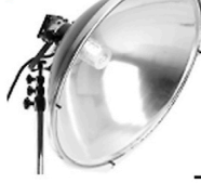
30,00 BLÄSING Reflektor f. Lampenkopf 90 cm hochglanz silber