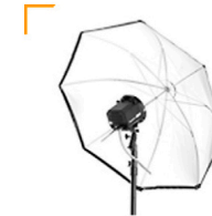
5,00 BALCAR Reflexschirm weiss 100 cm