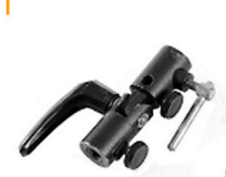
2,00 MANFROTTO Schirmneiger