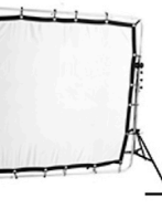
12,00 CALIFORNIA Sun Scrim, 1/3 + 2/3 = 3/3 6' x 6' = 183 x 183 cm