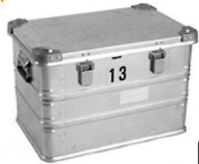
7,50 ZARGES Alu-Box K470 b:60 t:40 h:40 m