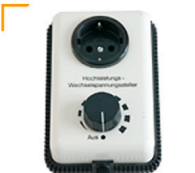
5,00 Hochleistungsregler 230 V / 16 A bis 2.000 Watt Halogen / Heißlicht