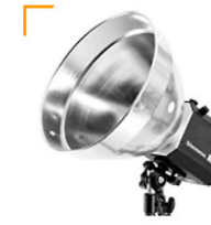
5,00 BALCAR Reflektor f. Lampenkopf 30 cm