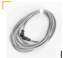
3,00 BALCAR Lampenverlängerungs- kabel 5 m

Softboxen und Großschirme für verschiedene Gerätemarken auf Seite 6/7