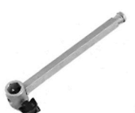
2,00 MANFROTTO Ausleger 20 cm