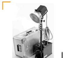
35,00 BALCAR Travel-Kit Generator 1600, Lampen- kopf, Stativ, Zargesbox