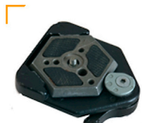
0,75 MANFROTTO Kamera-Schnellkupplung Platte mit 1/4 / 3/8 Gewinde