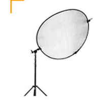
5,00 CHIMERA Reflektor gold/schwarz, 120 cm