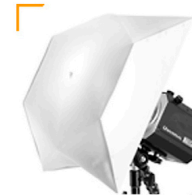
5,00 BALCAR Prisma Softbox f. Lampenkopf