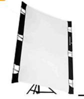
10,00 CALIFORNIA Sun Bounce weiss/silber PRO 4' x 6' = 130 x 190 cm