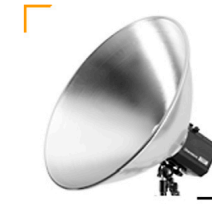
5,00 BALCAR Reflektor f. Lampenkopf 40 cm