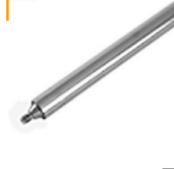
2,00 FOBA Combi Rohr 80 cm