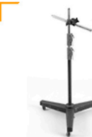
10,00 FOBA Systemstativ für Combi-Rohr 80 - 190 cm