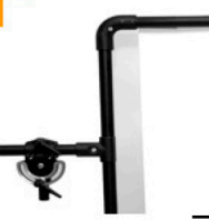
DETAIL MULTITUB 35 mm Rahmen Stativbefestigung bspw. m. Manfrotto Boom-Clamp