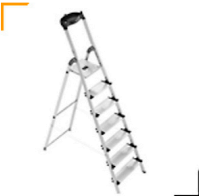
5,00 HAILO Aluleiter 8 Stufen Hohe 2,50 m