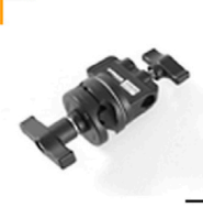
2,00 AVANGER Grip Head D200B 2 1/2"