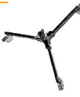
7,50 MANFROTTO Boden-Klappstativ 25 cm, Feststellrollen