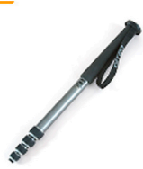
10,00 GITZO Einbeinstativ 50 / 200 cm