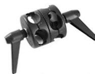
3,00 MANFROTTO Boom Clamp Multi Tube