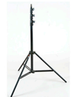
7,50 MANFROTTO Alu-Klappstativ 110 - 360 cm