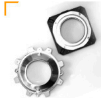
2,00 CHIMERA Softbox-Adapter für diverse Gerätemarken