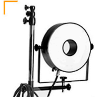
30,00 BLÄSING Ringblitz 14 / 43 cm