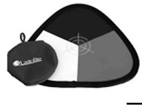
2,50 LASTOLITE Wetterfeste Graukarte v: weiss, grau, schwarz h: 3 x grau