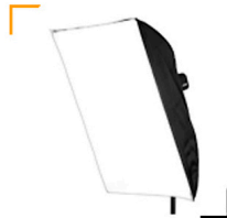
15,00 CHIMERA Softbox weiss 70 x 120 cm