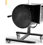
30,00 BLÄSING Windmaschine m. Stativ + Regler, 4200 m³/h