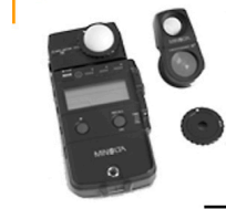
10,00 MINOLTA Flash IV Blitz-Belichtungsmesser direkt / indirekt / spot 1°