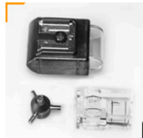
je 1,00 - Fotozelle - Synchron-Verbinder - Wasserwaage