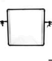
1,00 je qm Fläche MULTITUB 35 mm Rahmen individuelle Bespannung, Variabel von 1 x 1 b. 5 x 5 m