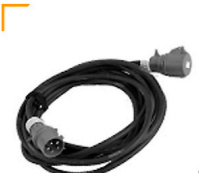
5,00 / 10,00 VERLÄNGERUNGSKABEL 415 V-32 A 5 m / 10 m