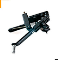
3,00 MANFROTTO Sky Hook