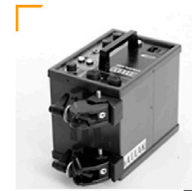
20,00 BALCAR Generator Star-Flash I - 1600 w/sec 8 Blenden / 2 Lampen