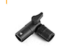
2,00 MULTITUBE 90° Gelenk