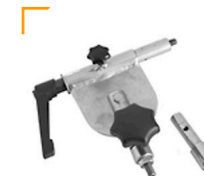
4,00 BLÄSING Neigegelenk f. Lichtformer an Boden-/Deckenstativen