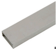
2,00 MANFROTTO Travers 15 x 35 mm Länge 200 cm