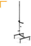
15,00 BLÄSING H-Fuß Einsäulenstativ Ausleger 30 - 450 cm