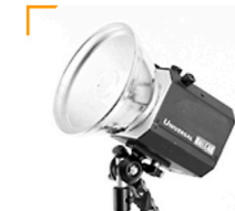
10,00 BALCAR Lampenkopf 3200 w max. / Kabel 3 m inkl. N-Reflektor