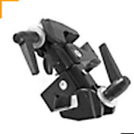
3,00 MANFROTTO Double Clamp