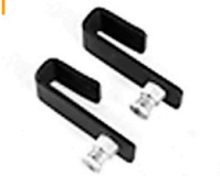
2,00 MANFROTTO Haken f. Travers 15 x 35 mm