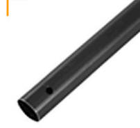
1,00 / 2,00 / 3,00 MULTITUBE Alu-Rohr 35 mm 100 / 200 / 300 cm