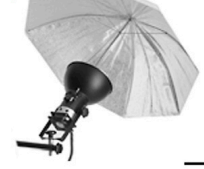
5,00 BLÄSING Reflexschirm weiss/silber 110 cm