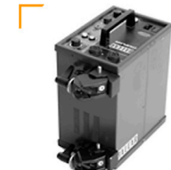
30,00 BALCAR Generator Star-Flash II - 3200 w/sec 8 Blenden / 2 Lampen