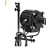
30,00 BLÄSING Fresnel-Spot 25 cm, Lampe fokussierbar, Projektionsaufsatz