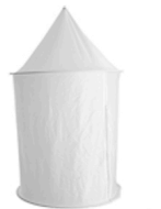
8,00 WALSER Lichtzelt 120 x 180cm