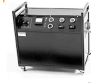
40,00 BLÄSING Generator HS - 5000 w/sec 2 Blenden / 3 Lampen