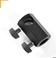
2,00 FOBA 90° T-Verbindung