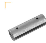
2,00 MULTITUBE Nahtlosverbindung von 2 Rohren