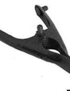
1,00 KLAMMERN Rundung für Rohre, 3/8 Bolzen u. Gewinde