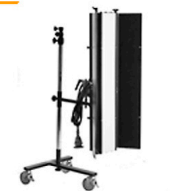
20,00 BLÄSING Strip-Light 16 x 120 cm 2 Klappen, Plexi plano