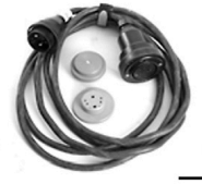
10,00 BLÄSING Lampenverlängerungs- kabel 5 m