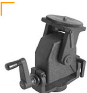
10,00 CAMBO Spindelneiger