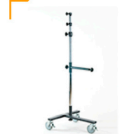
10,00 BLÄSING T-Fuß Einsäulenstativ Ausleger 40 - 130 cm Rohr 140 - 390 cm