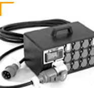
15,00 STROMVERTEILER EIN 415 V-32 A FI AUS 10x 230 V-16 A AUS 2x 230 V-25 A