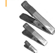
1,00 / 2,00 / 3,00 KLAMMERN Größe S / M / L Preis je 5 St./Größe