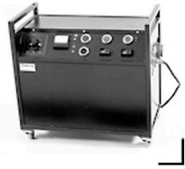
20,00 BLÄSING Generator HS - 2500 w/sec 2 Blenden / 2 Lampen