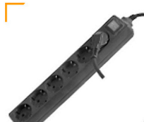
1,00 Mehrfachsteckdosen 230 V / 16 A Schukostecker