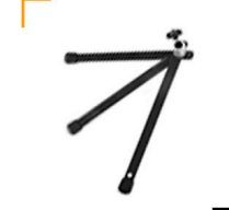
3,00 MANFROTTO Groundstand