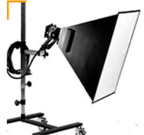
20,00 BLÄSING Lichtwanne 50 x 80 cm für Lampenkopf