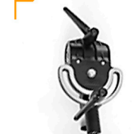
3,00 MANFROTTO Boom Clamp 35 mm Tube