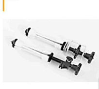
5,00 MANFROTTO Background Roll Holder m. Kette