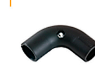
2,00 MULTITUBE 90° Verbinder