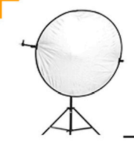
5,00 CHIMERA Reflektor silber/weiss, 120 cm