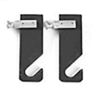
2,00 MANFROTTO Haken für Roll Holder