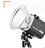
3,00 BALCAR NN Normalreflektor 17 cm