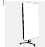
50,00 MUSCH an BLÄSING 100 x 200 cm / 5000 w/sec auf Manfrotto Bodenstativ. Front: LEE Diffusions-Folie