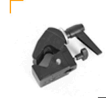
2,00 MANFROTTO Super Clamp