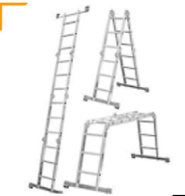
10,00 KRAUSE Multimatic 4x3 Stand-/Anlehleiter, Podest Hohe 450 / 200 / 90 cm