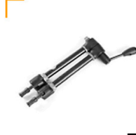
5,00 MANFROTTO Magic Arm