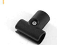
2,00 MULTITUBE T-Verbinder flach als Stand-/Auflagefläche